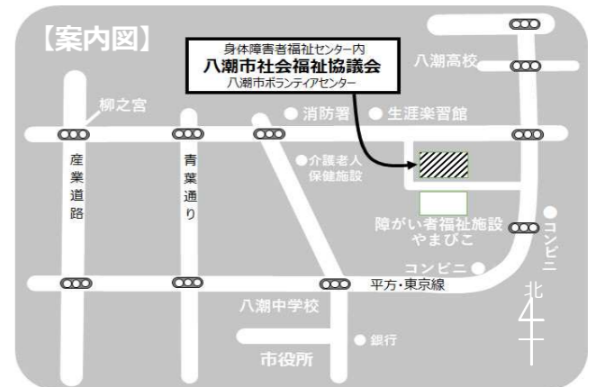
「ぬくもり」は、市内公共施設、小・中・高等学校などの協力により、各施設の窓口に設置しています。

TEL 048-995-3636 FAX 048-995-5287 ホームページ https://yashio-shakyo.jp/