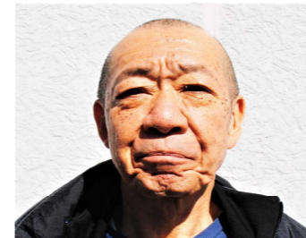
介護者家族会ひなた